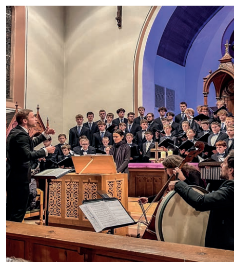
Konzert in Wachenheim

Das Programm, das die Windsbacher mit den Musikerinnen und Musikern der lauten compagney BERLIN aufgeführt haben, wurde Anfang des Jahres für CD aufgenommen und wird im Herbst beim Label Sony Classics erscheinen. Ein ausführlicher Bericht darüber folgt.